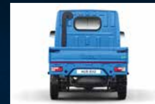
Mampu menanjak dengan beban berat sekalipun.