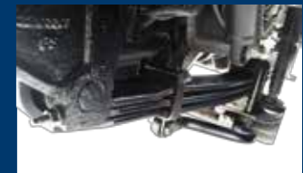
Parabolic Spring Suspensi depan menggunakan sistem Parabolic memberikan kenyamanan lebih, lembut namun kuat.