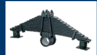
Tandem Bogie Suspension (6x4) dan MultiLeaf Spring (4x2) dengan desain baik mengurangi frekuensi gesekan.