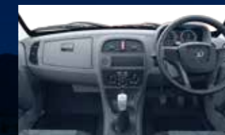
Desain interior lega, nyaman dan modern.