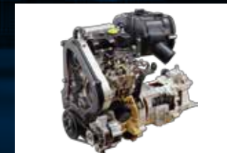
Diperkuat dengan mesin 2-cylinder, 702cc.