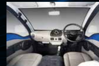
Desain dashboard terkini yang ergonomis.