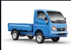
Dimensi Bak 2140 x 1430 x 300 mm