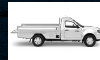
Bak muatan terpanjang dengan kapasitas muatan terbesar dikelasnya.