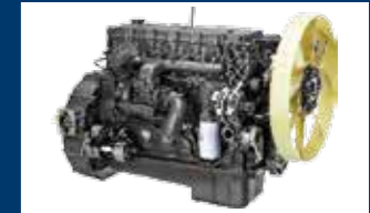
Dengan sistem High Pressure Common Rail Bosch dikontrol secara elektronik.