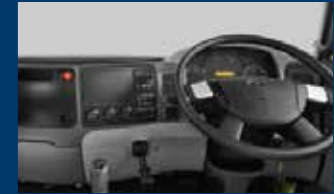
Kemudi & Kontrol yang Inovatif. Memudahkan pengemudi untuk mengatur posisi kemudi.