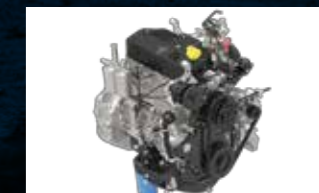
Didukung mesin turbo-charged DIESEL yang efisien.