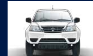
Desain lampu & bumper terkini yang modern dan gagah.